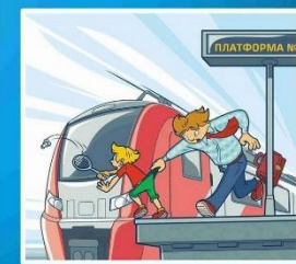
Платформа - не место для игр!