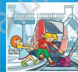
Нельзя переходить пути в неполюженном месте