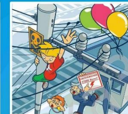
Приблизиться к проводам меньше чем за 2 метра - смертельно опасно!